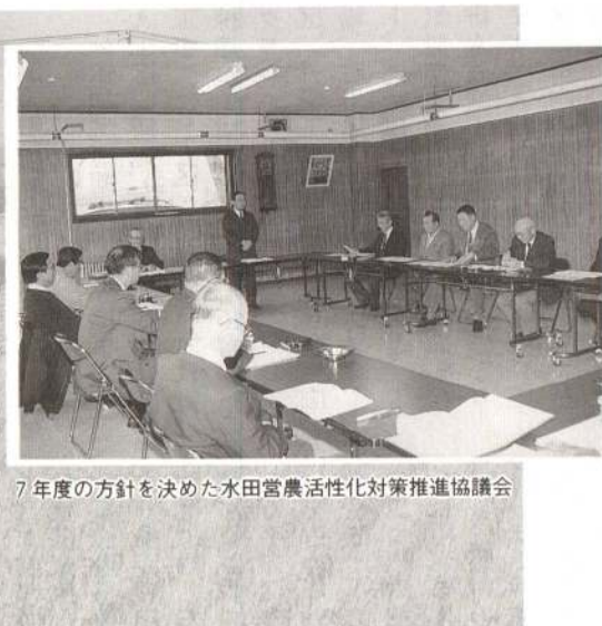
7年度の方針を決めた水田営農活性化対策推進協議会

▽家計と経営が分かれてなく、いわゆる「どんぶり勘定」になっている。▽家族内の労働関係があいまいで、しかも給与や休日の定めがない。▽相続の際の財産の分割問題など、経営の継続性の点で不安がある。と