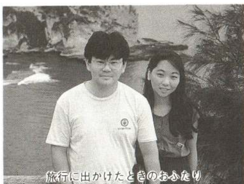
旅行に出かけたときのおふたり

ショッピングや食事をするところが少なく、購買意欲が起らないので、もっと活気のある、魅力的なエリアのある街にしてもらいたいと思います。また、冬場の観光施設が近くにないの、その辺をなんとかしてもらいたいと思います。