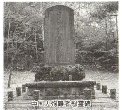
中国人殉難者慰霊碑

このような状況の中、ついに昭和二十年六月三十日、中山寮の中国人が一斉に蜂起、逃亡を決定したのです。しかし、全員が一週間以内に逮捕され、鉱山施設「共楽館」前の広場に集められました。七月の炎天下、この広場で行われた首謀者探し取り調べは厳しく、拷問や放置によって多くの中国人が死亡しました。