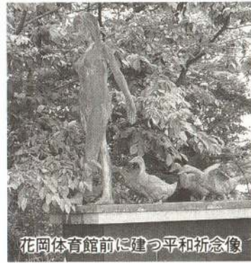
花岡体育館前に建つ平和祈念像

今年、全世界を巻き込んで多くの犠牲者を出した第二次世界大戦が終結してから五十年目という大きな節目を迎える年です。