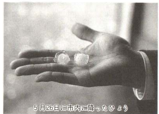
5月26日に市内に降ったひょう

害の程度が軽微であり、薬剤散布は通常防除で可能であると結論づけています。このため、これから行われる摘果が最も重要でありますので、関係機関と協力し、指導の徹底を図りたいと思います。