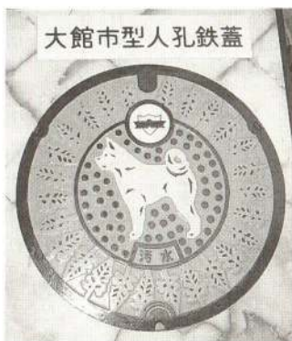
大館市型人孔鉄蓋

◎公共下水道についてのご相談は、 下水道課（内線340・356） へお気軽にどうぞ。