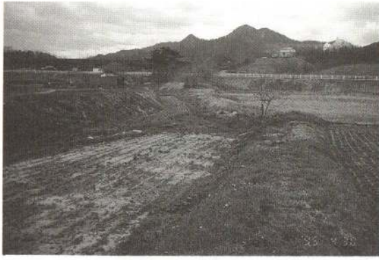
▶旧花岡川の面影を残す 信正寺西側七ツ館付近

繁沢を南下する川は、右岸に「大國主神社」(市の指定文化財である「虚空蔵菩薩」を祀り、丑寅年生まれの人たちの守り本尊として