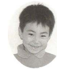
なみおか かずきくん よるいっしょにロボット であそぶんだ。