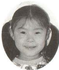
さいとう ふうちょうちゃん わたしたちをドライブにつ れていってくれるの。