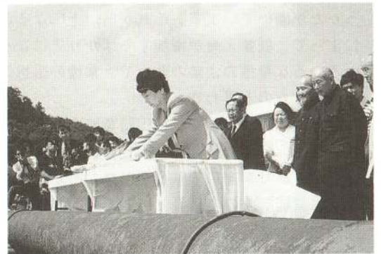
土井衆院議長も慰霊式に参列、現地で献花。(滝の沢ダム・旧中山寮)