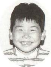
よねざわ たいちくん おすもうするといつもほくがかつよ。