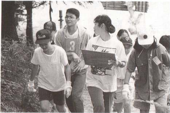
▲7月31日からの3日間の日程で教育委員会主催のリーダー研修会が開かれました。市内小中学校の代表56人が参加しオリエンテーリングやボランティアの実際などの研修を行いました。