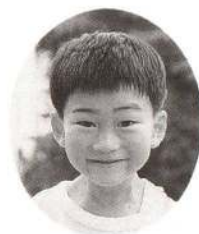
はが しょうへいくん しゅっちょうがおおいけど、いっぱいあそんでくれるよ。