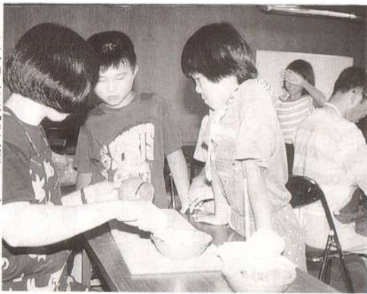
▶真中公民館主催のちびっこ陶芸教室が八月三日開催されました。