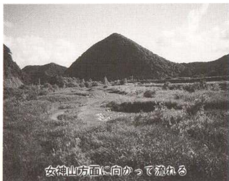
女神山方面に向かって流れる

下内川に沿った羽州街道は古くから人や文化の重要な交流路であり、街道沿いに多くの集落を生んだ。川は矢立峠付近で南に進路を変え、陣場・長走集落に沿って流れる。これらの集落はいずれも十六世紀末、峠が開発されたころにできたものであり、長走には雨乞いのために殺した犬を神様として祭った多茂木神社がある。