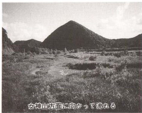
女神山方面に向かって流れる

下内川に沿った羽州街道は古くから人や文化の重要な交流路であり、街道沿いに多くの集落を生んだ。川は矢立峠付近で南に進路を変え、陣場・長走集落に沿って流れる。これらの集落はいずれも十六世紀末、峠が開発されたころにできたものであり、長走には雨乞いのために殺した犬を神様として祭った多茂木神社がある。