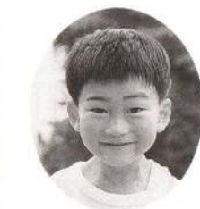
はが しょうへいくん しゅっちょうがおおいけど、いっぱいあそんでくれるよ。