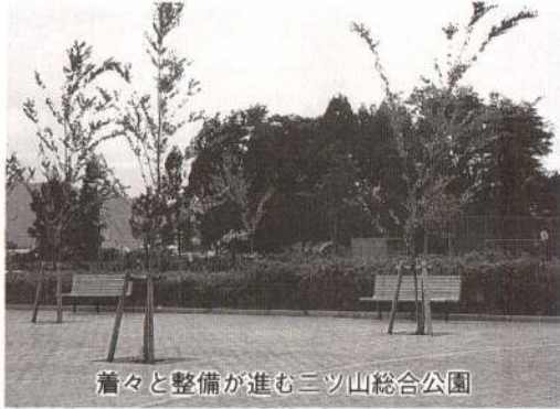
着々と整備が進む二ツ山総合公園

一、八七二万円 ・中道南児童公園用地購入費など ▽公園新設費 四、七七五万円 ・二ツ山総合公園新設工事費追加など