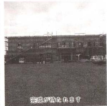
完成が待たれます

労働力の資質向上と産業各分野の活性化を目指します。また、企業等の自主研修の場として、地域住民へ開放しての各種講座・講習、会議などの場として利用できるよう計画しています。 センターの開設は全国で年間二、三カ所ほど。県内での開設は本荘市、大曲市に次いで三つ目となります。