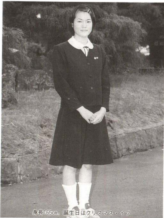
身長165cm。誕生日はクリスマス・イブ