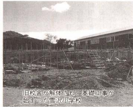
旧校舎が解体され、基礎工事が始まった雪沢小学校