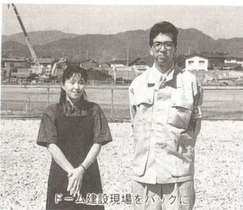
ドーム建設現場をバックに

郊外のファミリーレストランや買物をする際の各種専門店、広い映画館やゴルフ練習場など手軽な娯楽施設が少ないこと、JRによる新幹線へのアクセスが悪いことを感じています。今後は若者が集える場所を考えた街づくりに期待します。私が建設に従事している大館地区多目的ドームも、そういった意味で有効に活用していただければうれしいですね。