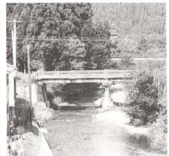
激しい攻防が展開された三階橋周辺

関係が深く、最近まで十二所から鉦山に働く人が往来したという。現在、別所川沿いの道はメインランド尾去沢への観光ルートとして、また花輪方面への近道として利用されている。この時期、流域の山々の紅葉を楽しみながら、その道を行くとき、川はすべての歴史を忘れたかのように静かに流れている。