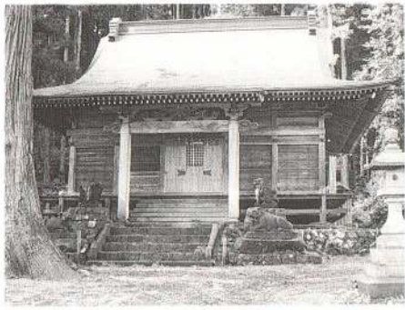
阿弥陀仏が祀られている大日堂

別所川の中流、別所集落の北側一角に大日如来を祀る大日堂がある。現在の社殿は明治三十四年(西暦一九〇二)に改築されたもので、境内には「三本マツカの杉」など数十本の巨木が神々しい雰囲気醸し出している。米代川流域には、小豆沢(鹿角市八幡平)、独鈷(北秋田郡比内町)の大日堂があり、