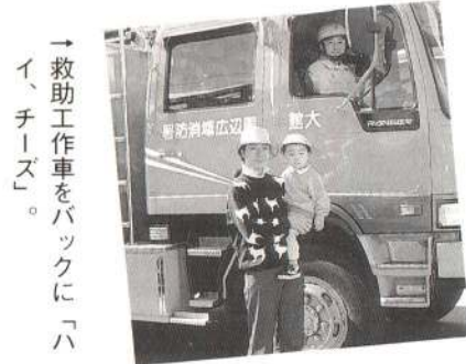
→ 救助工作車をバックに「ハイ、チーズ」。