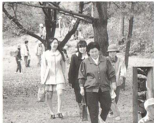
↑ 芝谷地には「初めて来た」というかたがほとんどで、「大館にこんな素敵なおところがあったなんて…」と感心しきり。