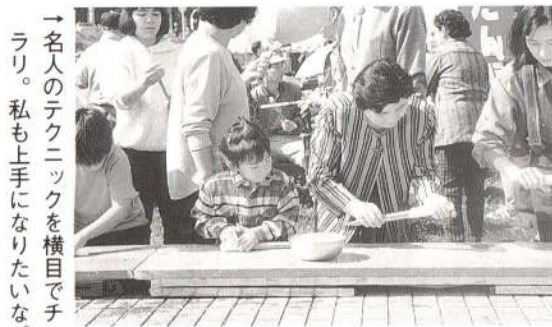
→ 名人のテクニクを横目でチラリ。私も上手になりたいな。