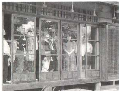
↑ 烏潟会館では本格的京風庭園と歴史ある邸宅の味わいにうっとり。