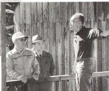
↓ 松下村塾では、明治政府の要人を多数輩出した幕末の思想家「吉田松蔭」に思いをはせて。