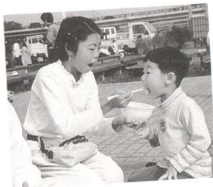
↑「はい、あ〜んして」。おねえちゃんに食べさせてもらうきりたんぼの味はまた格別。かな？