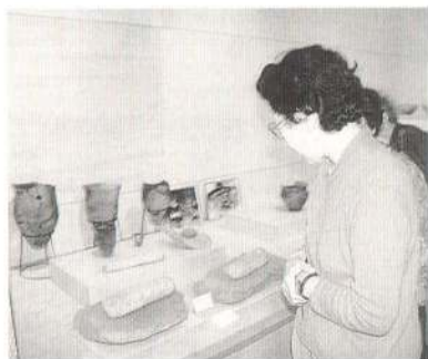
← 市内の遺跡から出土した土器や石器が一堂に。