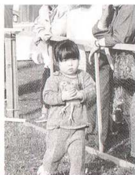
← 見て見て、ひよこさんつかまえたよ。私とどっちがかわいい？