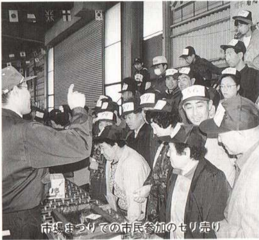
市場まつりでの市民参加のセリ売り