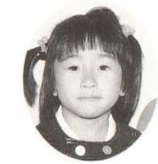
五十嵐 けいちゃん わたしが大きくなったら漫画家になるんだ。