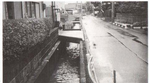
食糧事務所わきを流れる小十郎川

「小十郎川」であったと思われる川で遊んだり、馬を洗ったりしたことがあるという人もいるようだが、場所や川の名前ははっきりしないらしい。幻の「小十郎川」をぜひ突き止めたいと思っているの