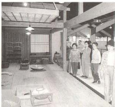
体育館を改造した展示室(昔の民家の復元)

6年度に体育館の内部を改造して展示室が完成しています。今年度は校舎を改造して美術工芸展示室、資料収蔵室、スタジオ、古・公文書室、研修室、学習室などを造り、8年4月のオープンを目指しています。