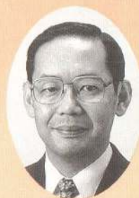
大館能代空港ターミナルビル 運営がいよいよスタート

先ごろ、大館能代空港ターミナルビル運営会社が第一回取締役会を開き、その運営がいよいよスタートいたしました。その中で役員を選任も行われ、初代社長には、大館市長が就任することになりました。従来の空港ターミナルビルは、県主導というやり方をしてきたわけですが、空港のできる地域の首長が社長になったということは、今度は大館、能代、鹿角、鷹巣をはじめとする米代川流域地方拠点都市地域の皆さんが主導となってこの空港ターミナルビルを運営していくという、全く新しい形になったわけです。これは責任が地域にかかってくるなど大変なことでありますが、画期的なことであり、拠点都市の中核としてのターミナルビルにふさわしい経営形態ではないかと私は思っています。ターミナルビルの建設にあたっては、予算などいろんな制約はありますが、その中で最大限にこの地域の自然、森林、木材といったものを前面に出し、空港へ到着したときに「ここが米代川流域地方拠点都市地域なんだなあ」ということが一見してわかるような空港づくりをしていきたいと思えます。 空港の発展のためには、地域の皆さんも空港完成前だけ一生懸命頑張るといったのではなく、開港後もおおいに利用し、全国に飛び立っていただきたいし、また、たくさんのお客さんを迎え入れることが必要です。空港の目的の一つには、空港・ターミナルビルを中心にしながら、どんな他の地域に出かけ、交流し、見聞を広め、地域の発展につながるということがあります。これらはあくまでも手段であり、ターミナルビルの運営にあたってはそういったことを前面に出して努めていきたいと思っています。