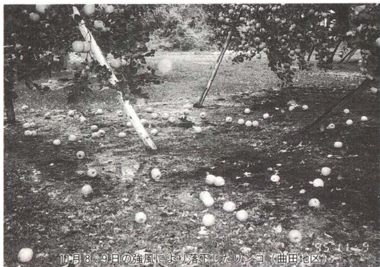
11月8、9日の強風により落下したリンゴ（曲田地区）

体が不作で、農家収入が減収となつてから、県の救済施策と連携しながら、各種制度資金に対する利子補給など経営再建の対策を講じ、来年度以降の営農意欲の高揚に努めたいと考えています。