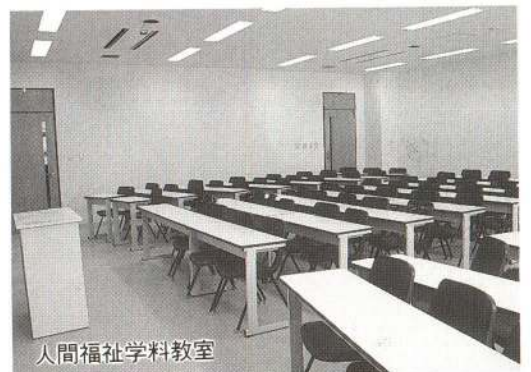
人間福祉学科教室

同短大に設置されるのは、三年制の看護学科（入学定員五十人）及び二年制の人間福祉学科（同四十人）、地域社会学科（同百人）の三学科で、この春には市内外からの百九十人の第一期生がキャンパスをにぎわすものと思われま。開学後は同短大の教育目標である「地域に根ざし地域社会に貢献できる人材の育成」はもちろんのこと、約五百人もの学生、教職員による経済的・文化的効果などは、地域活性化の面からも期待されます。（12ページに関連記事）