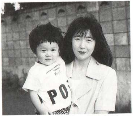
一人で積み木で遊んだり、絵本を見たりして、おりこうさんしているんだよ。