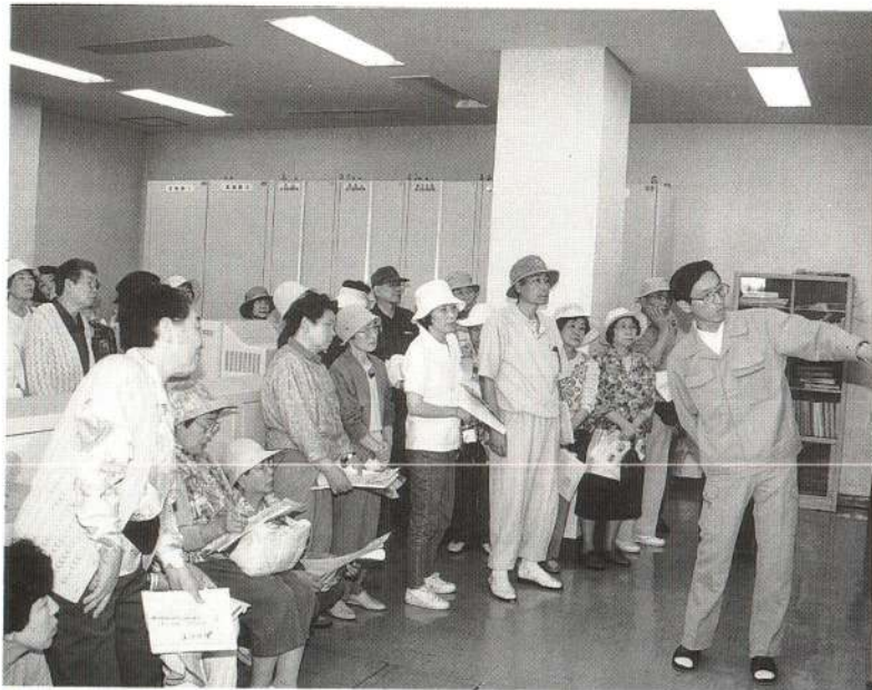
△「水は自然にあるものではなく、税金で作られているものだ」とわかっていただければ幸いです。

六月二十七日、市内の施設や名所旧跡などを巡る「LOVE・ODATE『ふるさと探検号』」が二コースに分かれて行われました。参加者は日ごろあまり見ることでできない施設などを熱心に見学していました。