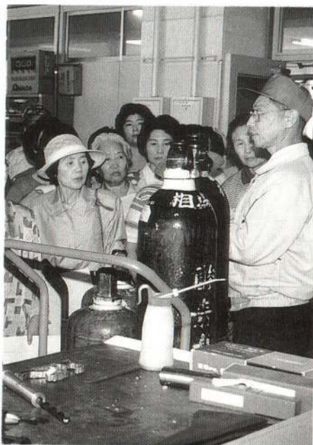
△最新のコンピュータなどで先進的な学習をしている職業能力開発短期大学校。