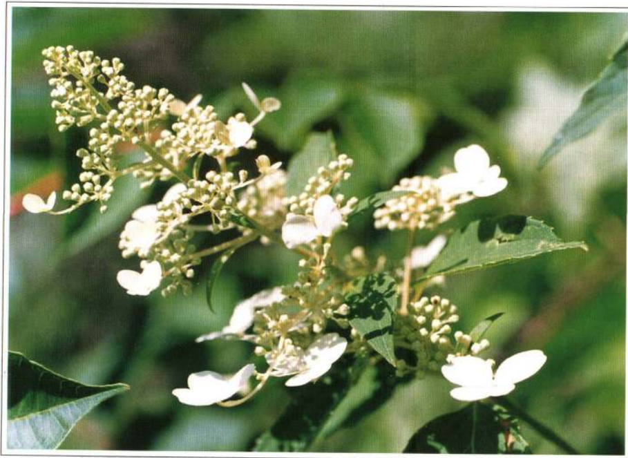
ノリウツギ (ユキノシタ科)

芝谷地は今、ヨシの繁茂、周田からの樹木の侵入、増殖、湿原の陸地化現象などで困っています。