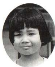
佐々木 希ちゃん 仙台に連れてって。そうしたら、もっと大好きになるよ。