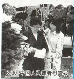
6/30 中国人殉難者慰霊式