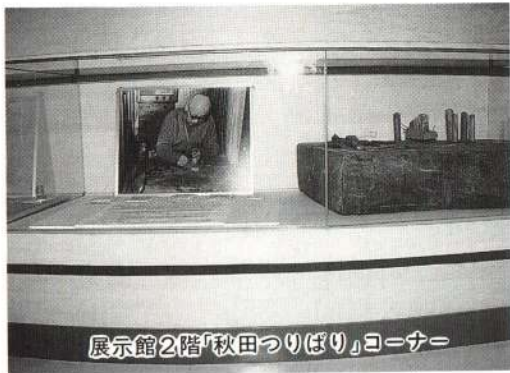
展示館2階「秋田つりばり」コーナー

秋田つりばり、すなわち大館つりばりは、江戸時代後期に武士の内職として大館で作られはじめた。明治二十六年（一八九三）、シカゴ万国博覧会で絶賛を受け、同二十八年の京都での第四回内国勲業博覧会で優等賞を獲得。宮内省から商標として菊の紋章を許さ