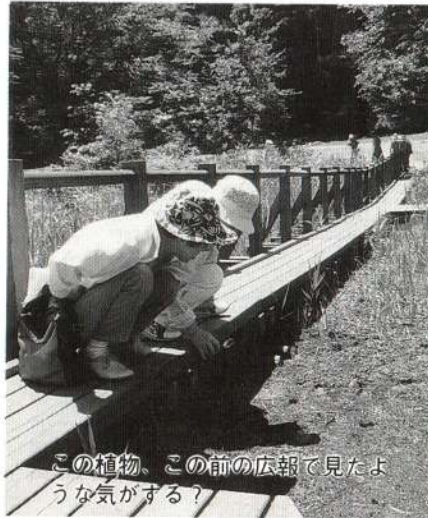
この植物、この前の広報で見たような気がする？