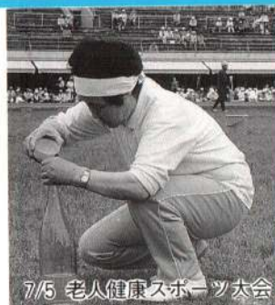
7/5 老人健康スポーツ大会