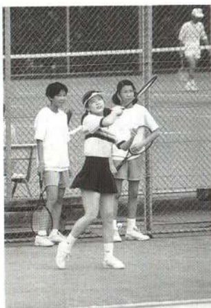
▲ ソフトテニス。 ボールはどこにいったの？

9月1日、第5回大館市スポーツ・レクリエーション祭が開催されました。当日は朝から小雨の1日でしたが、すべての競技で熱戦が展開されました。市内13地区の対抗戦で6種目が行われ、見事長木地区が総合優勝しました。