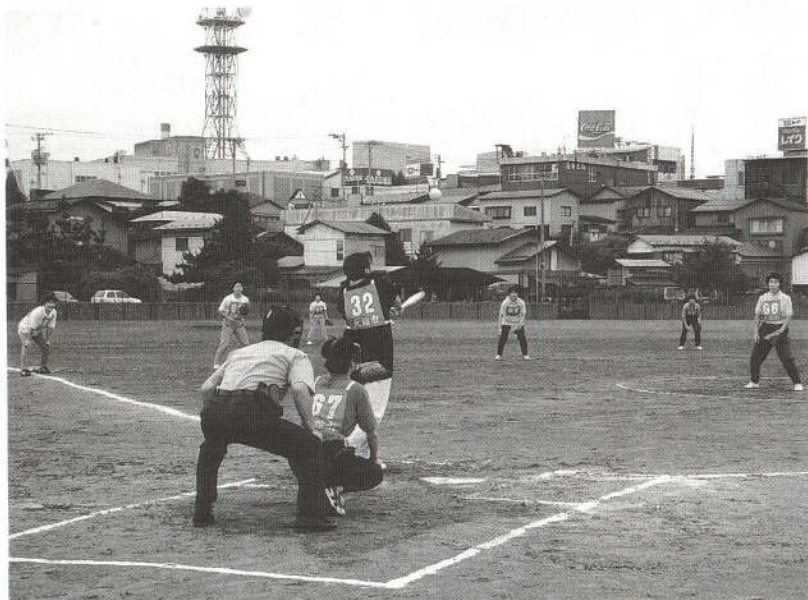
▲ 元気いっぱいに行われたソフトボール。