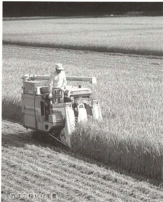
昨年の稲刈り風景