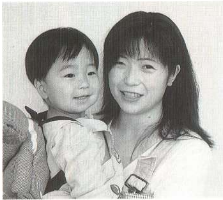
人見知りをしないでだれにでも声をかけるから、みんなに好かれているんだ。