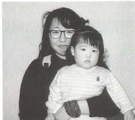
お兄ちゃんと一緒に遊んでいるせいか、意志の強い子なんです。