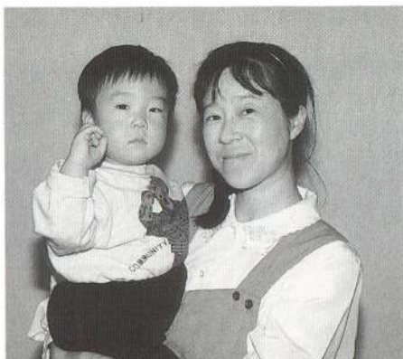
保育園でも家でも元気すぎるくらい遊んでいます。