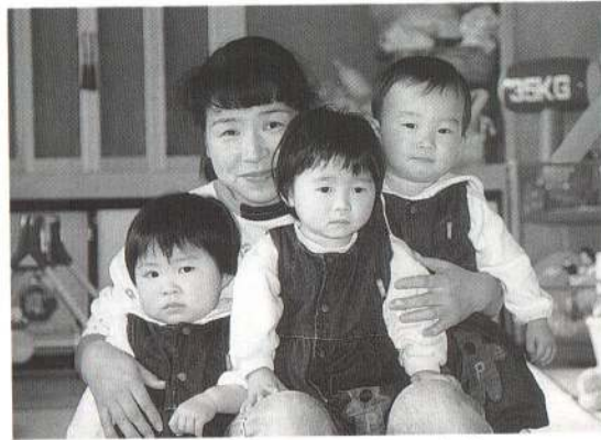
三つ子の子育ては苦労も喜びも3人分。遊ぶとき、けんかするとき、いつも一緒です。