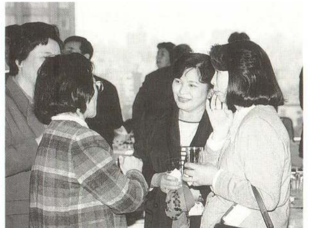
▲会場のいたる所で、「あらっ 久しぶりねえ 元気だった？」の声が