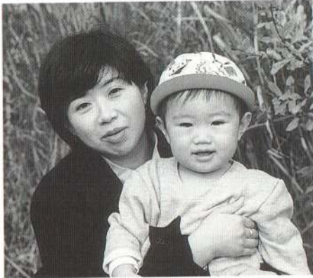
いたずら盛りで生傷が絶えません。目が離せないわんぱく小僧君です。