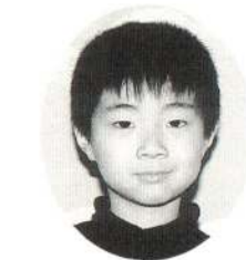
金 剛広ちゃん お正月にお年玉をいっぱいくれたんだ。うれしかったよ。