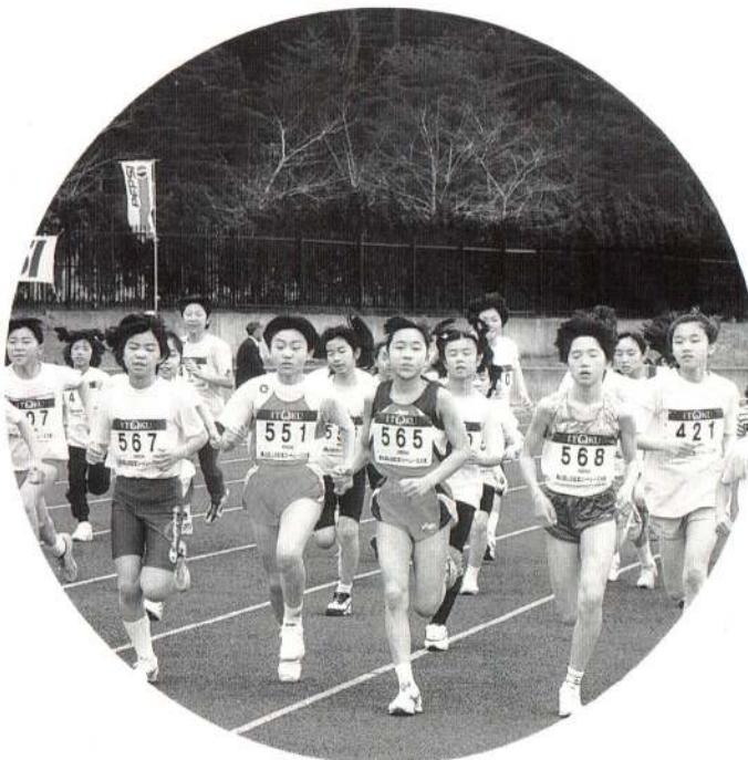
▲ 第45回山田記念ロードレース大会が4月29日開催されました。