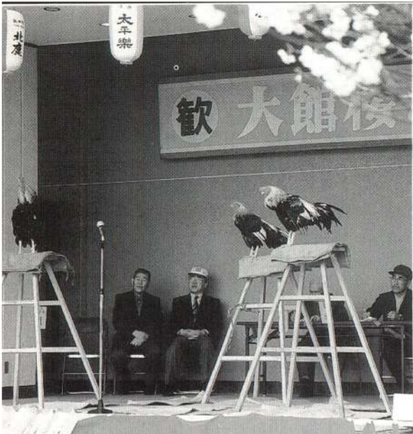
▲ 4月29日に行われた声良鶏の展覧会。自慢の鳴き声が響き渡りました。