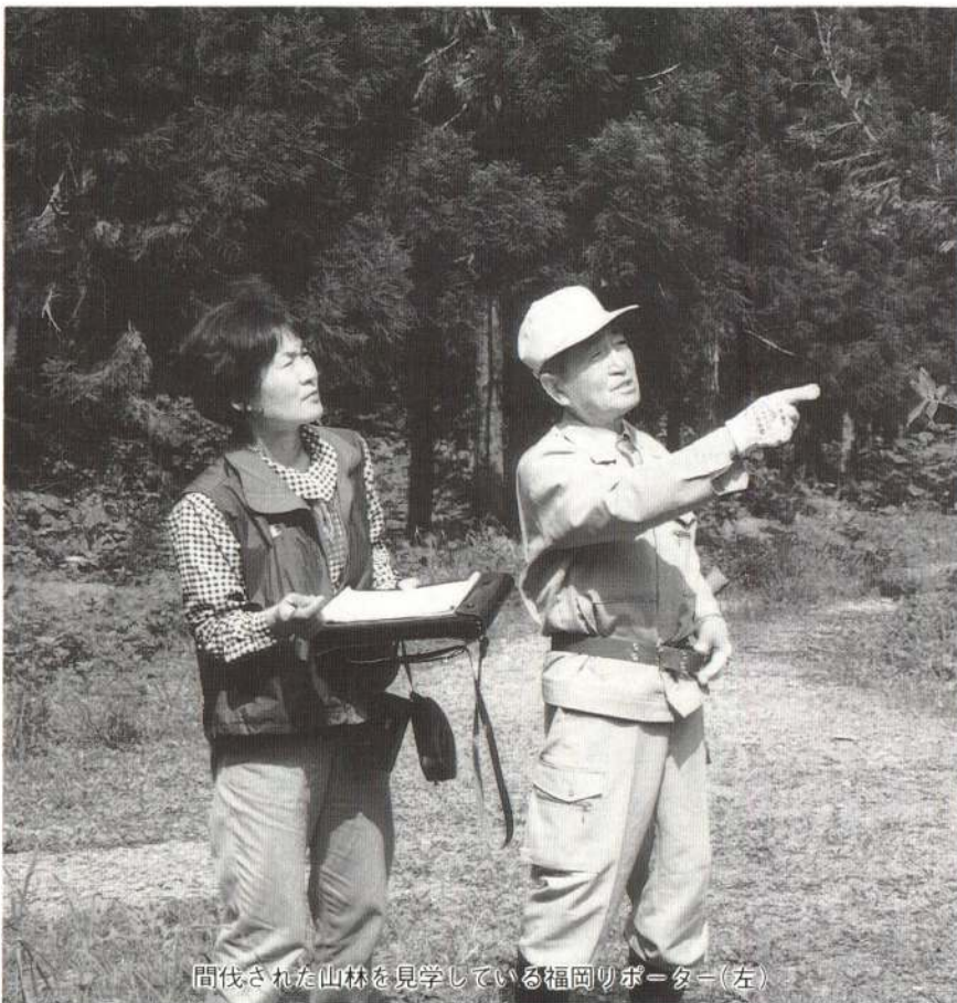
間伐された山林を見学している福岡リポーター(左)

森林公社として、市民がもっと森林に親しめるような森林浴ラリーや四季折々の行事を実施してはどうでしょうか。なお、これからは市民の財産として、また貴重な自然環境としての森林づくりにご尽力ください。