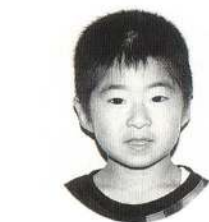
みうら ゆうせいくん いっしょに買い物に行くといつもゲームで遊ぶよ。