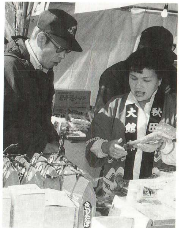
大館の物産であるきりたんぼや漬物、地酒などが飛ぶように売られていました。