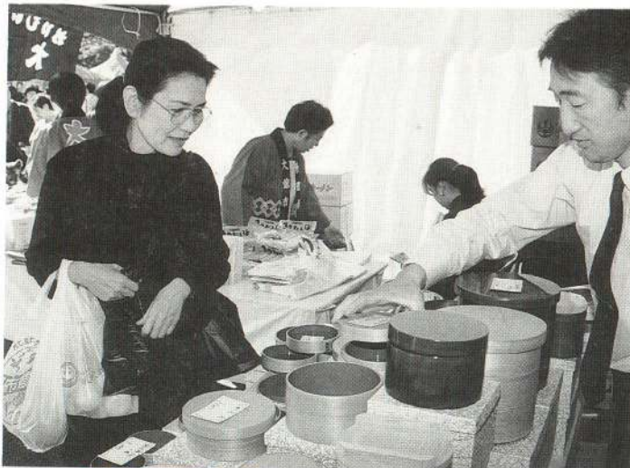
大館の伝統的工芸品である曲げわっぱには、製造法などを熱心に質問されるかたもあり、出展した目的を達成しました。