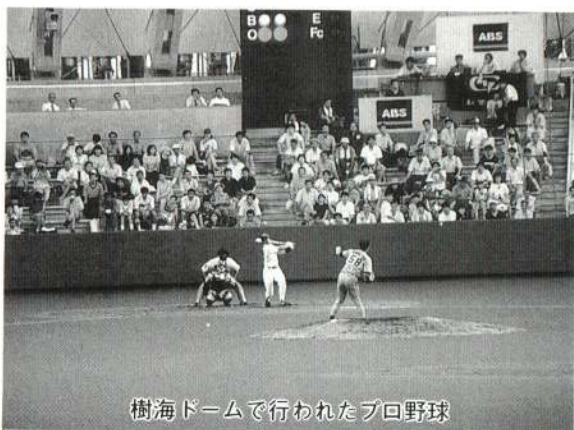
樹海ドームで行われたプロ野球