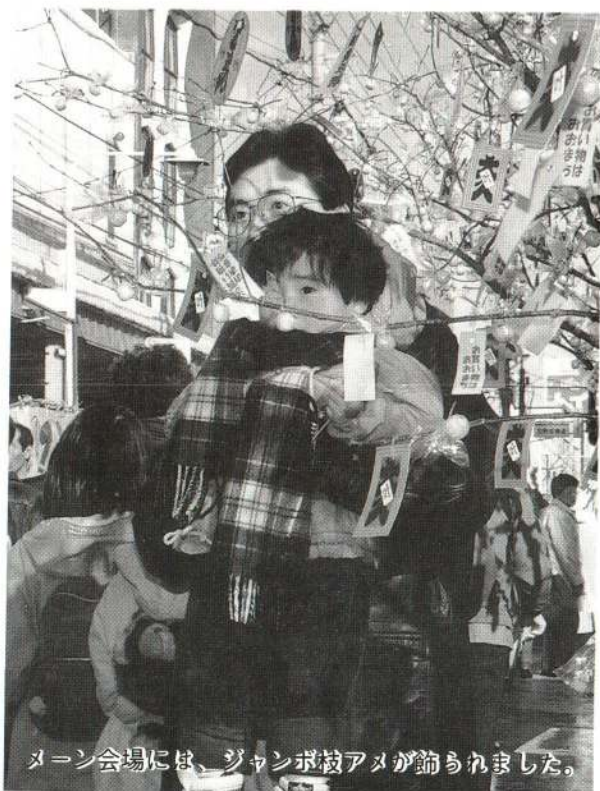
メイン会場には、ジャンボ枝アメが飾られました。