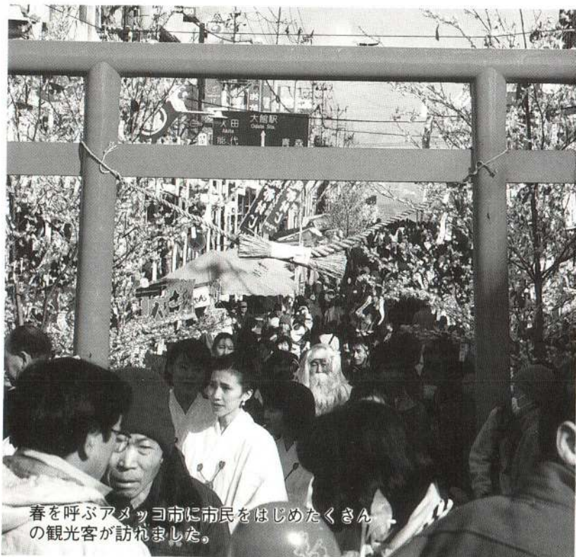
春を呼ぶアメッコ市に市民をはじめたくさん の観光客が訪れました。