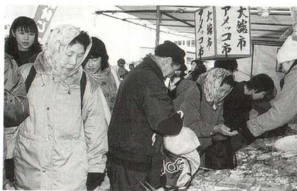
多くのかたがアメを買って いました。

四百年前から続いている大館市の伝 統行事「アメッコ市」が、大町通りを主 会場に開催されました。この日は、県内 外からたくさん観光客が訪れ、大いに にぎわいました。