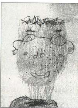
のろ こうすけくん おやつをいっぱいくれるし、 機関車で遊んでくれるんだ。