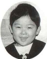
ふくはら まさきくん いつもやさしくて、笑っている おじいちゃんが好き。