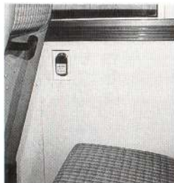
座ったままで手が届く降車お知らせボタン

八月十八日から運行を開始している市内循環バス「ハチ公道」。日中の買い物や通院などに、主婦やお年寄りのかたが多く利用しています。また、今まではなかった大館駅方面から片山方面へ乗り換えなしの利用もできます。 一週間ほどたったある日、十一時に発車したそのバスの乗客が一番多いときで十四人ほどでした。ほとんどの乗客が買い物に出かける女性客だったようです。各停留所ですべて待っているお客さんの多くは、まだ見慣れないハチ公道がどこを通るのか分からないようでした。そのためか運転手さんは、お客さんが乗るごとに丁寧に行き先を尋ねていました。 「御成町二丁目から楽に帰れるようになった」と城西体育館前で降りていったおばあちゃんの声。また、沼館温泉前から乗車した二人のおばあちゃんは、温泉にきた帰りでハチ公道は二回目の利用とのこと。自宅付近の豊町バス停からでは、今までは利用できるバスがなくタクシーを利用するか、大町まで出るかしなければならなかったそうです。ハチ公道は一本で沼館方面へ行けるうえに、一時間ごとの運行なので便利になったと大変喜んでいました。 自家用車のないかたも気軽に市内を回ることができそうです。どんどん街に浸透し、市民の足となってくれることでしょう。