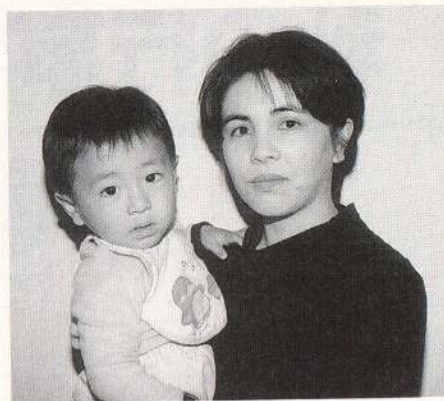
いつもお兄ちゃんとお姉ちゃんに泣かされるけど「あいうえお」が言えるんだよ。