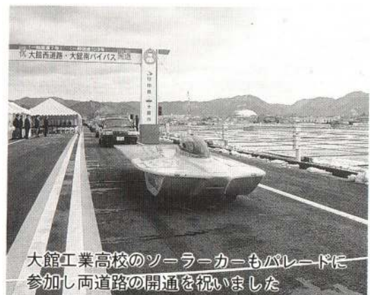
大館工業高校のソーラーカーもパレードに参加し両道路の開通を祝いました

本二路線の開通は、市内通過交通の分散による交通渋滞の緩和や物流のスピードアップによる農林