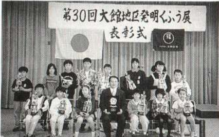
大館地区発明工夫展で特賞を受賞した子供たち

有浦小の自慢というところ、何とんでも「発明工夫」です。全国発明くふう展で、恩賜記念賞という日本一の賞を、平成五年、七年、九年と三度も受賞。今年の地区発明工夫展には、百三十八点も出品。親子で取り組むことが伝統になっています。