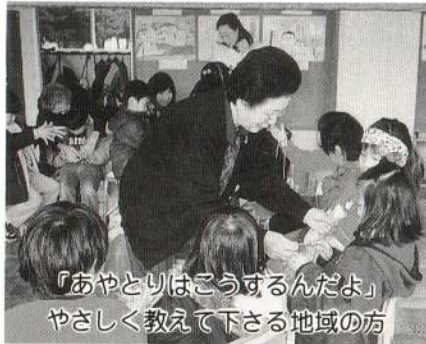
「あやとりはこうするんだよ」やさしく教えて下さる地域の方

公園や長木川周辺のクリーンアップを頑張っています。また、二月には、来年入学する園児たちを招待しての交流会を実施。チョッピリ先輩気分を味わっています。