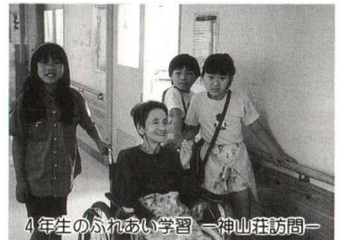
4年生のふれあい学習 一神山荘訪問一

今年から、水交苑、神山荘、大館園を学級ごとに訪問。お年寄りと直接ふれあう経験のない子供たちは、最初のうちは恐る恐る話しかけていました。しかし、お年寄りの笑顔と涙を流して喜ぶ姿に子供たちは感動。