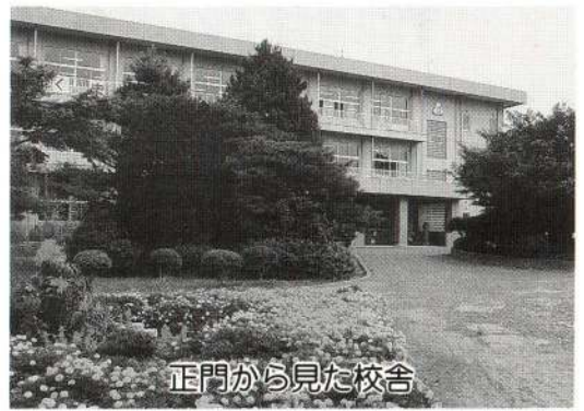
正門から見た校舎

と、校歌の一番にあるように、有浦小学校は昭和十五年四月、美しい田園の中に尋常小学校として創立されました。 学区は、大館駅から長木川にいたる商店街や住宅街、及び周辺の新興住宅地などからなり、新旧が交錯する若く活力あふれる地域です。そのためか、児童数の減少はなく、今や市内一の大きさととなりました。 昭和五十一年、火災による校舎消失という悲しい出来事もありました。しかし、美しい前庭の木々は健在。春の桜、そして秋の紅葉の美しさは「かしこくゆたかに たくましく」頑張る有浦っ子の姿とともに、本校の自慢の一つです。