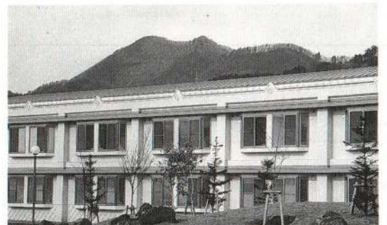
完成した特別養護老人ホーム(右)とケアハウス(左奥)

幌便が四八%となっており、前月比では大阪便を除いて十数ポイントの減となっています。