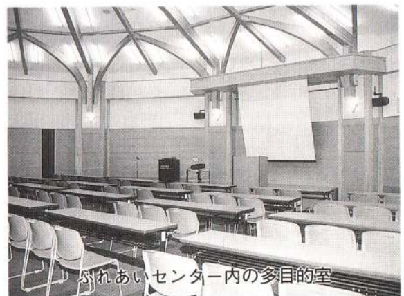
ふれあいセンター内の多目的室

コミュニティセンターを含め、これらの県の施設のオープンは今年の秋ごろの予定です。