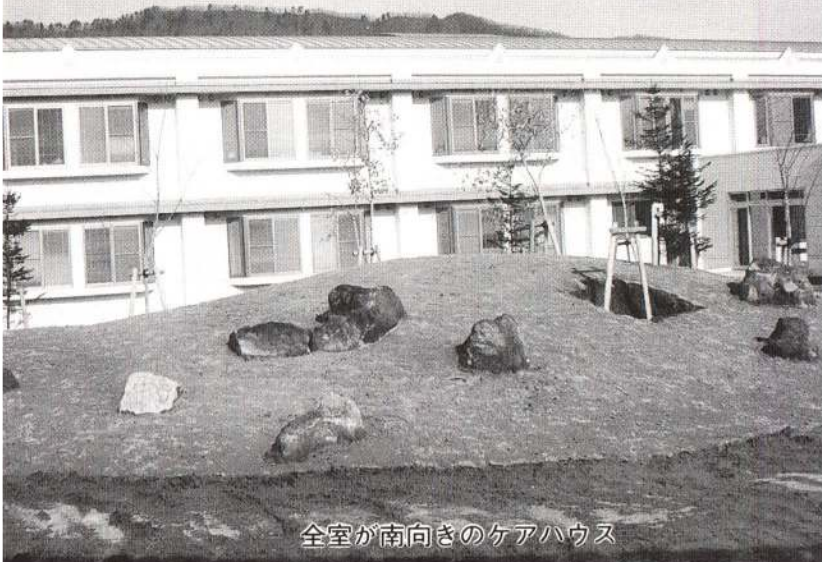
全室が南向きのケアハウス

すべての部屋を南向きとし、暖房は床暖房、明るく快適に生活できるつくりとなっています。また、各居室には安全性を考慮し、火を扱う必要のない電気式調理器を設置しました。そのほか、水洗トイレ、ミニキッチン、緊急呼び出しシステムなどが完備され、安心して生活できる場となっています。共用設備としては、広いスペースを持った食堂・集会娯楽室のほか