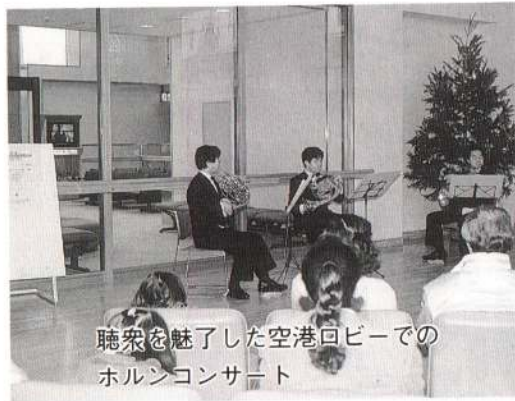
聴衆を魅了した空港ロビーでのホルンコンサート

る」という返事。当然だと思わない方がおかしいと思う。 なぜ、観光客が気軽に持ち帰れる観光パンフレットが置いていないのだろう。なぜ、この様なことが起きるのか？ 利用者の声がちんと届いていないのではないかと？ 利用率の向上には、利用し