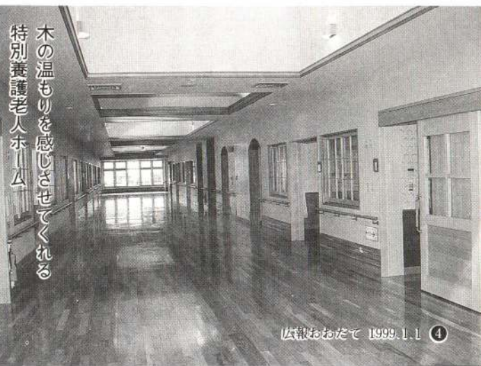
木の温もりを感じさせてくれる特別養護老人ホーム

内壁は木を基調としているため、温もりを感じさせられるうえ、廊下天井からの採光や随所にサンルームを設けるなど、明るく、やさしさも感じられるつくりとなっています。また、暖房には床暖房を採用し快適さも確保しました。さらに、入所者の状況に応じて、個室、二人部屋、四人部屋を準備しました。