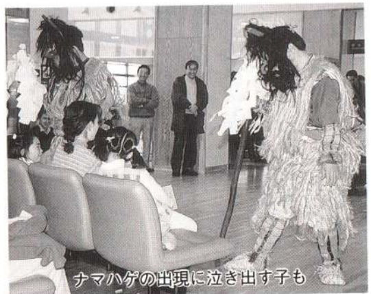
ナマハゲの出現に泣き出す子も

先月の十二日に空港のロビーでホルンによるコンサートが行われた。地元の人々が楽しんだものと思う。こういった形の空港利用もすばらしいと思う。空港の活用にとどまるのではなく、空港によってもたらされる効果を最大限に活用してほしいのである。注文も多くなってしまったが、多くの人が大いに期待している空港なので、ぜひこたえてもらいたい。そして、すばらしい大館能代空港にしてほしい。