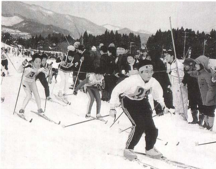
▲ノルディック・リレー競技では、各チームが一斉にスタート。応援にも一番熱が入ります。