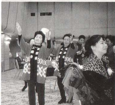
▲首都圏在住の大館ふるさと会との交流会では、市民号に参加した方々が大文字踊りを披露してくれました。なつかしい話に話題は尽きることはありませんでした。

1月23日から25日まで3日間、市長を団長とする交流と観光の旅「大館市民号」が実施されました。今年にあきた北空港開港を記念して、復路を空路に渋谷区との交流の旅を行いました。旅程に含まれていた、大館ふるさと会との交流では、和気あいあいとふるさと話に花が咲きました。