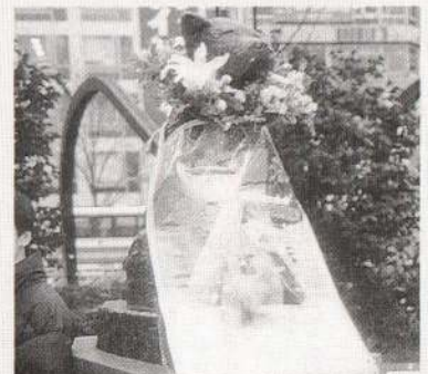
▲忠犬ハチ公像への献花も行われました。