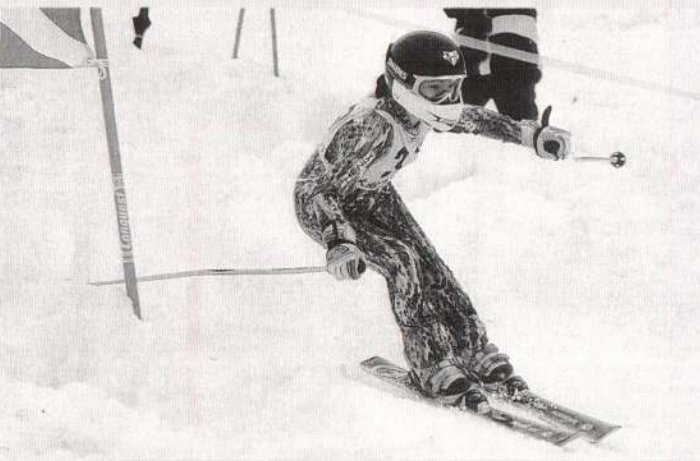
▲二本の合計タイムで競い合った、アルペンの大回転競技。