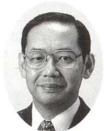
あきた北空港 開港一周年