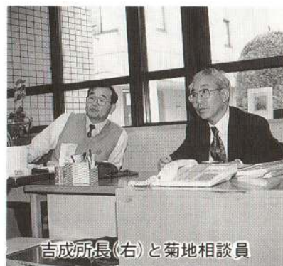
吉成所長(右)と菊地相談員

昨年の上と比べては総数八十一件、その中で、上位はいじめ・友人関係、続いて家庭環境、不登校、非行、異性への関心、その他となっている。いじめの件数はかなり減ってきているものの、依然相談のトップ。表面に出にくい事例を