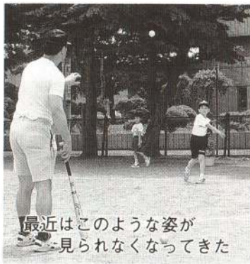
最近はこのような姿が見られなくなってきた