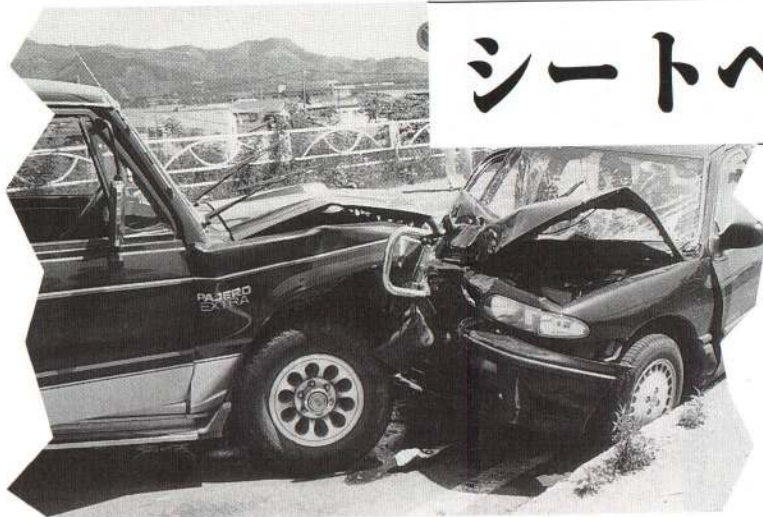
シートベルト着用率調査(8/2実施)