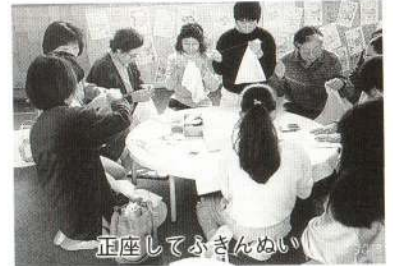
正座してふきんぬい

農作業が一段落した時期に、子どもたちと家族のかたが一堂に会して「ふるさと集会」を実施しています。およそ130人の家族のかたが参加し、学校全体がはちきれんばかりに動いていると言っても過言ではありません。まずはお父さんの出番、冬に備えて通学路の「防風ネット張り」です。見事な連携プレイで1時間余りで終了しました。今年の降雪量はどうなることでしょうか。次は、お母さんによる「大型紙芝居の読み聞かせ」で、アクションや語りが会場の笑いを誘っていました。最後は、いろいろなコースに分かれての「祖父母交流会」です。縄跳び、竹馬・紙飛行機、昔の遊び、剣道、空手など多種多様な交流が展開され、参加者全員でもみじ、を合唱して終わりました。子どもたちは、家族と一緒に自分の住む地域の有形・無形の文化にふれ、いろいろな技をもっているお年寄りと交流し、地域のよさを実感できた一日となりました。