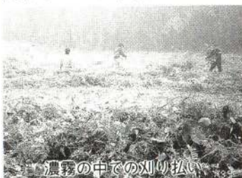
濃霧の中での刈り払い

大館市民スキー大会は大滝温泉スキー場で行われますが、十二所地区PTA連絡協議会の会員がスキー場の刈り払いを行っています。会員といっても成章小学校と成章中学校のPTA会員で、活動は春と秋の2回です。春は午前5時ころから作業を開始しますが、100台以上の草刈り機の作動する音が山々にこだまして壮観な光景です。今年の秋は濃霧が立ち込め、辺り一面まっ白、隣の人の姿もよく見えない状況で行いました。春に比べて人数が少ないこともあり、例年より時間がかかり、終わったのは午前8時半を回っていました。霧の中からやっと顔をのぞかせた朝日が、すっきりした山の斜面を輝かせていました。市民の皆さん、来年のスキー大会の会場整備は無事終了、万全です。