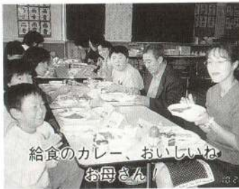
給食のカレー、おいしいね お母さん