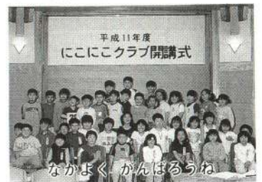
なかまよく、かんぱろうね

学校のすぐ隣に北部シルバーエリアが建設されました。そのふれあいセンター「やまびこ」に「にこにこクラブ」が発足しました。主な会員は、本校の1年生から3年生までのおよそ40人の児童ですが、放課後センターに立ち寄って本を読んだり、子ども広場の遊具で遊んだりして一人ひとりが伸び伸びと過ごしています。また、ケアハウス「ほうおう」のお年寄りと触れ合うことができ、手作りのおやつをごちそうになったりして、子どもたちの活動が幅広く豊かなものになっています。高学年児童の中には、友だちと一緒にエリアを訪ね夏休みの自由研究のテーマにするなど、自主的な活動への熱意が育ってきています。今後はセンターと学校の連絡を十分にとり、交流を工夫していきたいと考えています。