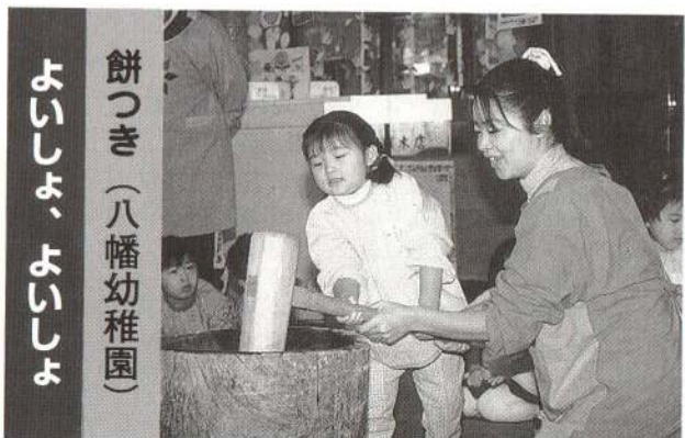
餅つき(八幡幼稚園)