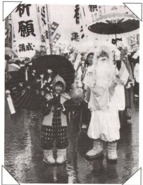
◀白ひげ大神とおこうの巡行——枝あめを持つおこうちゃん姿がかわいかったですね。