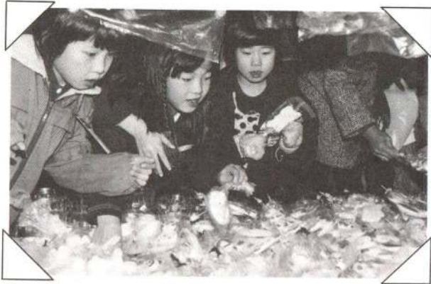
▲枝あめや切りあめなど、色とりどりのあめがいっぱい。どれを買おうか、迷っちゃう。