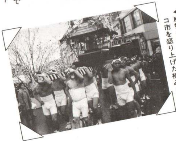
◀威勢のいい掛け声で、アメッコ市を盛り上げた裸みこし。