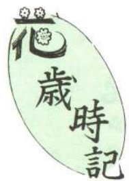
かんのんちく 観音竹

「花の好きな方を募集」——広報「花歳時記」に登場していただく花の好きな方を募集しています。自薦、他薦を問いません。どうぞ広報統計係 (49-3111内線268) へお知らせください。