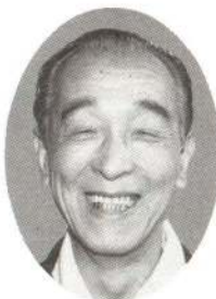
大館八幡神社宮司

誕生しました。これらはいずれも私たちが市民の大きな宝です。大切に守っていきましょう。