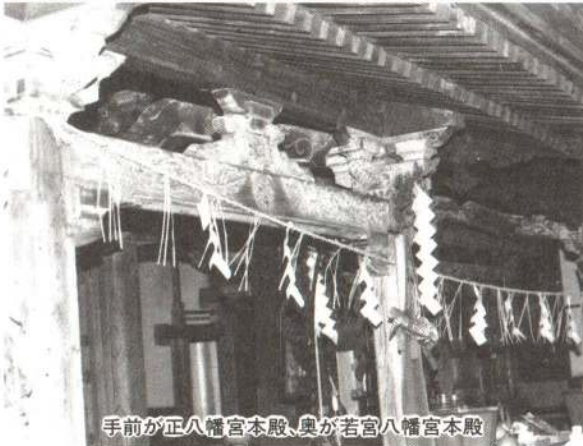
手前が正八幡宮本殿、奥が若宮八幡宮本殿