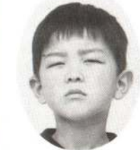
かぶともり じゅんやくん おかあさんのわらったかおがたすき