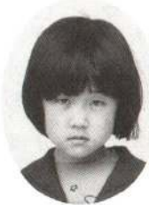
まるや ゆかりちゃん おかあさん、りょうりがじょうずなの