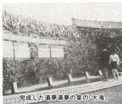
完成した湯夢湯夢の里の「大滝」