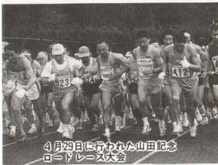
4月29日に行われた山田記念 ロードレース大会