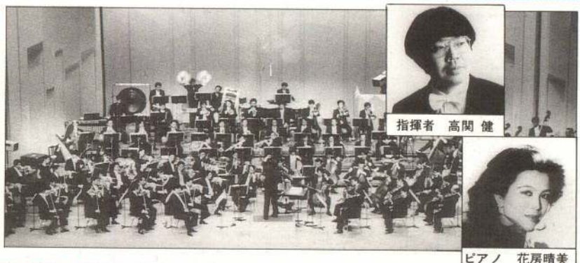
指揮者 高関 健