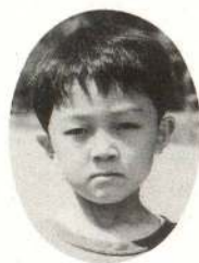
やまうち たかひとくん あんまりおこらないよ。やさしいんだ。