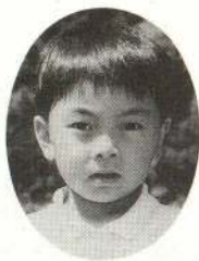
ささき けいすけくん おりょうりがじょうずで、おいしいよ。