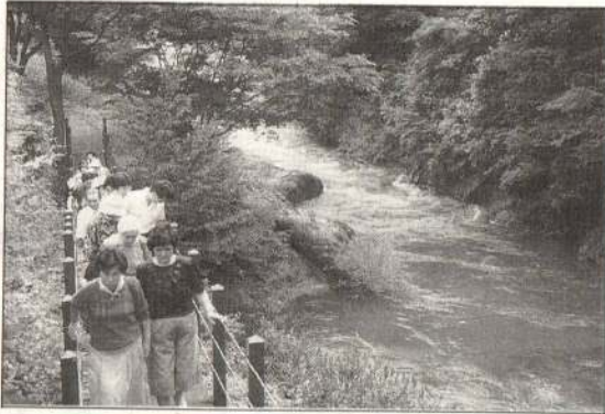
▷長木溪流を眼下に

「わあ! 素晴らしい所だったんですね。」遊歩道から見下ろす溪流も、大館の再発見でした。