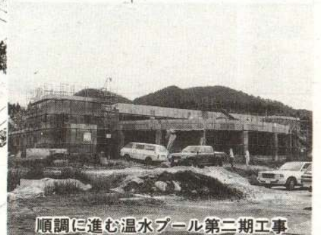
順調に進む温水プール第二期工事