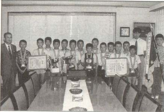
◀市長室でチョッピリ緊張?

全日本学童野球県大会でみごと初優勝。全国大会(水戸市)でもガンバレノ釈迦小ナイン。