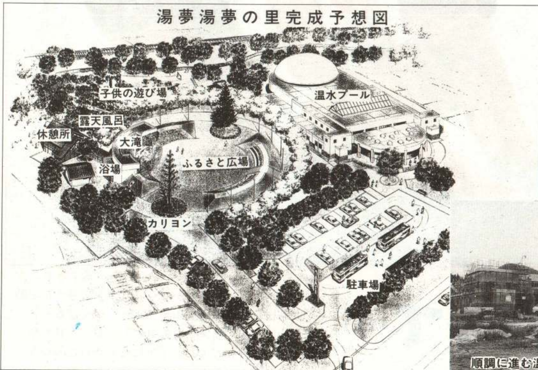
湯夢湯夢の里完成予想図

今年度第二期工事に着手している温水プールは、完成すると次のような施設になります。建物の中には、高さ五メートル・長さ五十四メートルのウォータースライダーが三レーン、直径三十五メートルの円周に幅約五メートルの流水プール、五コースとれる二十五メートルの幼児用プール、児童用プールのほかに事務室やロッカーなどが設けられます。屋内施設ですので、年間を通した利用が可能になります。