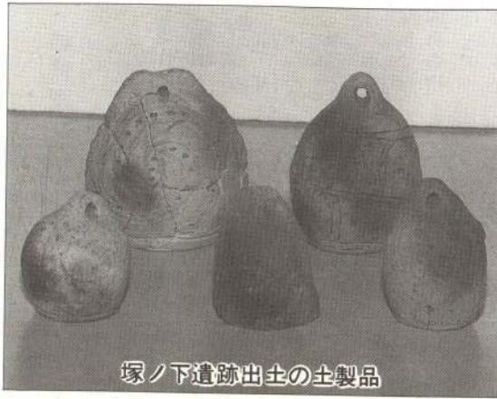
塚ノ下遺跡出土の土製品

木川と大茂内川によってつくられた扇状地が開けています。その扇頂部の大茂内集落北側に形成された平坦な諏訪台地上の用水池畔には、縄文時代前・中期の土器が包含されている「大茂内遺跡」があります。同じ台地上の「諏訪台遺跡」では、縄文時代の堅穴住居跡・配石遺構とともに弥生時代・平安時代の堅穴住居跡が確認されています。