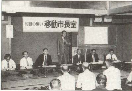
▶7月26日の二井田公民館会場