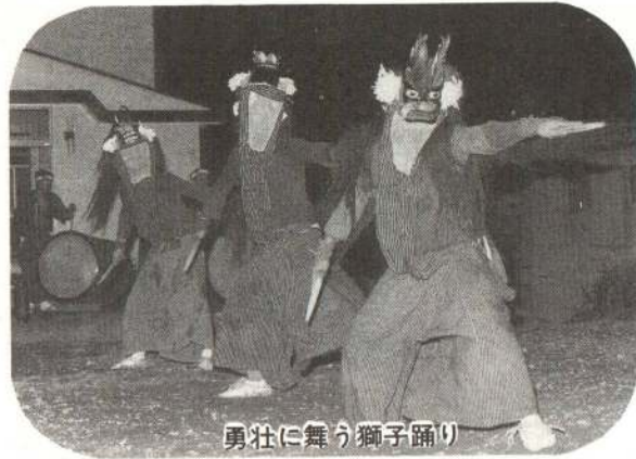
勇壮に舞う獅子踊り

川口の獅子踊りは、佐竹氏が秋田に転封後、大館に移り住んだ佐竹氏の家臣によって伝えられたんだそうです。その獅子