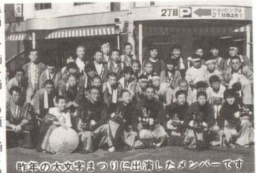
昨年の大文字まつりに出演したメンバーです

棒踊り、獅子踊りの順に踊るのが一般的なんです。でも、私的には棒踊りがありませんよ。それを覚えていた人がいなかったからで、とても残念です。