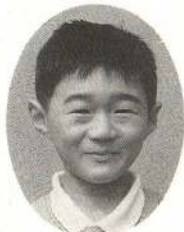
おおさわ ゆきやくん こんどいっしょにか くれんぼしようよ。