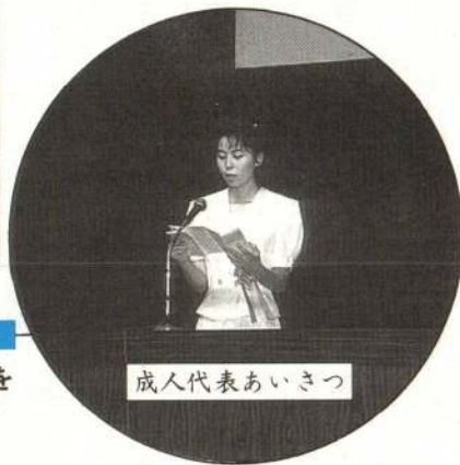
成人代表あいさつ