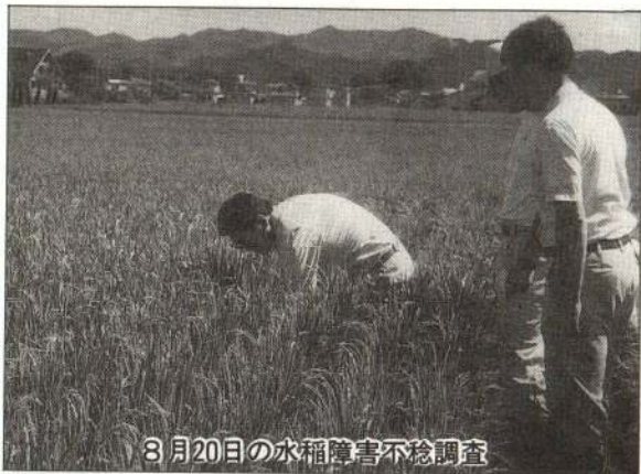
8月20日の水稲障害不稔調査

続する異常気象は市の農業に大きな被害をもたらしました。そして今年も七月中旬以降の長雨低温に加え、日照不足。ついに四年連続の異常気象に見舞われました。