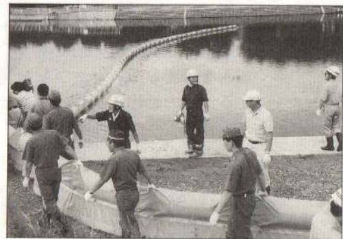
油の流出事故等を想定したオイルフェンス設置訓練（8月21日・長木川白鳥飛来地で）