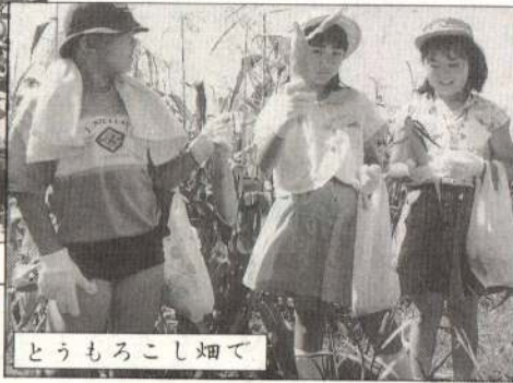
とうもろこし畑で