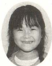
あだち あやちゃん おとうさんはやさしく ってください。