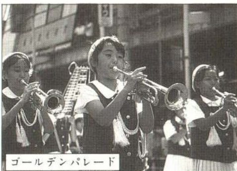
ゴールデンパレード