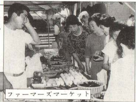
ファーマーズマーケット