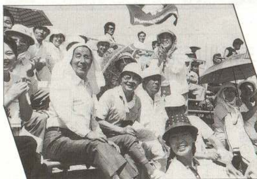
◀同じ地区の選手の活躍に応援にも熱が