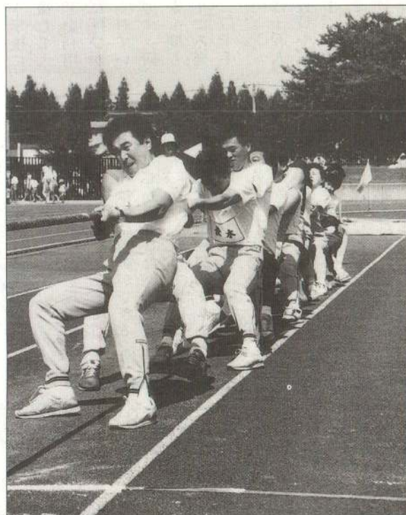
◀ワッショイノワッショイノ渾身の力を振り絞っての力比べ (綱引き)