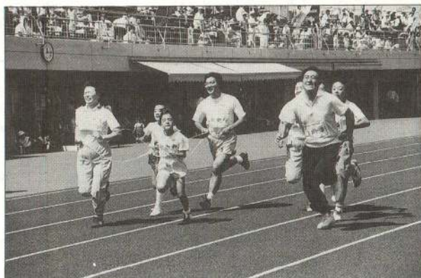
▲ゴール目指して疾走する親子列車 (親子汽関車レース)