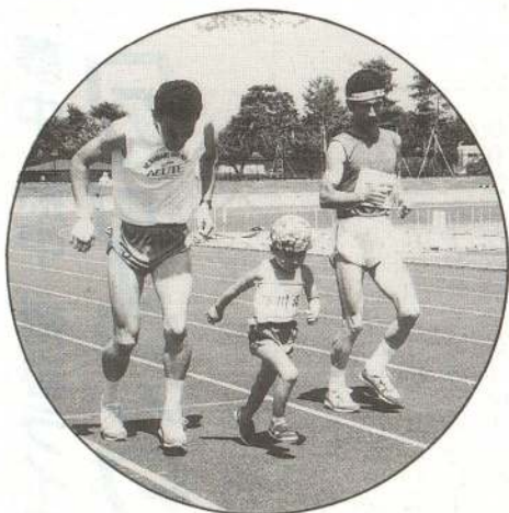
▲ガンバレノゴールまであと少しだよ (ジョギング)

前日の雨もあがり、青空が広がる秋晴れとなった9月1日、大館市民大運動会が長根山陸上競技場で開催されました。この大運動会は、市民の体力向上と各地区の親ほくを深めるため昭和55年から開催しています。今回は13地区から選手、応援団など約3,000人が参加。アメ食い競争、年齢別2人3脚リレーなど23種目の競技に熱戦を展開していました。