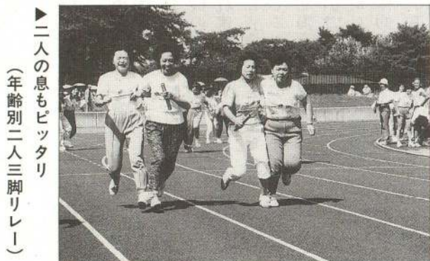
▶二人の息もピッタリ (年齢別二人三脚リレー)