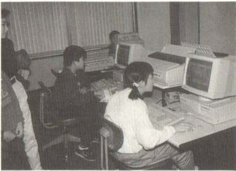
パソコンのコーナーで子供たちは夢中。上達も早い？