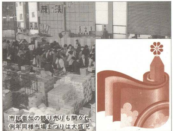
市民参加の競り売りも開かれ、例年同様市場まつりは大盛況