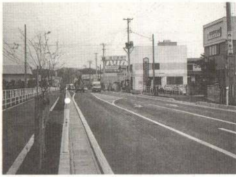
拡幅工事が完了した沼館線の三百メートル区間

市では、大館西道路の側道と接続する都市計画街路・沼館線の拡幅工事を進めています。昭和六十三年度に着手した清水交差点から沼館へ向かって約三百メートル区間の工事が今年十月に完了。残る約八百メートルについても早期に拡幅したいと考えています。