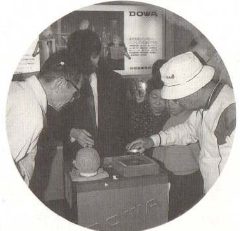
商工展では同和鉱業グループが超電動体を実演。話題の製品だけに興味津々です