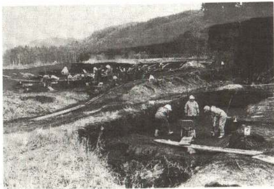
山王台遺跡の発掘調査風景

果樹園が広がる中山地区には、縄文期の土器や磨製石斧などが採取された寒沢遺跡、縄文土器が採取された兔沢遺跡、縄文中・