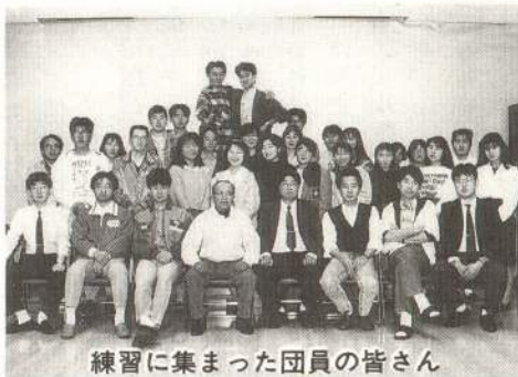
練習に集まった団員の皆さん

クリスマスコンサート開催などです。また、吹奏楽コンクールへの出場、県内の社会人吹奏楽団との交流を積極的にするなど、演奏技術のレベルアップを図るようにしています。