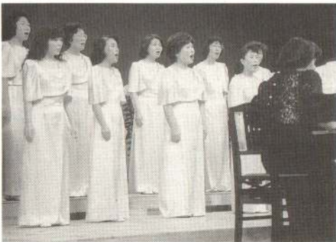
佳麗な声で聴衆を魅了したCOILOMGの皆さん